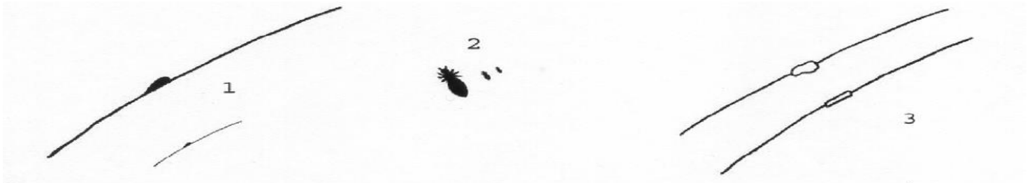
1. Nisse (vergrößert und Originalgröße)